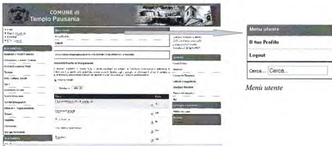
Posizione Menu utente